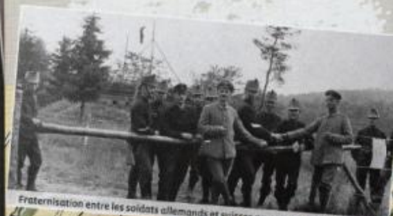
Fraternisation entre les soldats allemands et suisses au poste du Largin Sud - 1918.

Se munir néanmoins d'un éclairage individuel et de bonnes chaussures.