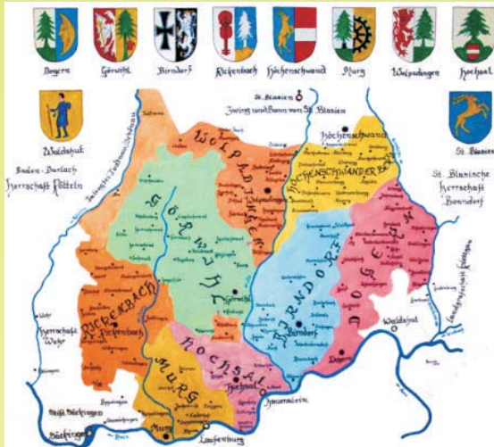
Wandkarte der ehem. Grafschaft Hauenstein mit den acht Einungen

Wir wollen nach Urkunden, Akten und Unterlagen zur Geschichte der ehemaligen Grafschaft Hauenstein mit ihren 8 Einungen forschen und bei der Bevölkerung das Interesse dafür wecken. Wir machen Vorträge und Führungen in den 8 Einungen und im Einungsmeistermuseum mit angegliederter Waffenkammer in Dogern. Wir bauen ein Archiv auf mit bereits erschienenen Büchern und Abhandlungen über unsere Heimat. Dazu kommen auch von Einungsmeistern zu diesem Thema verfasste Beiträge.