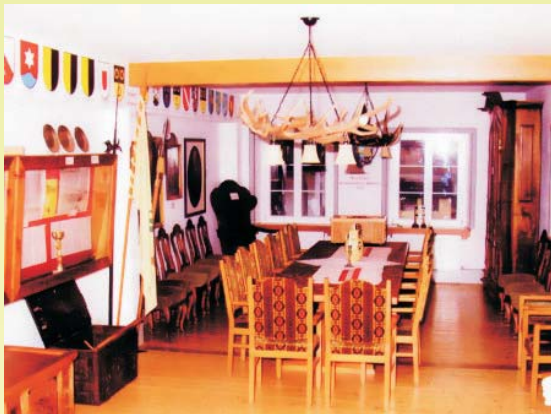
Die Einungsmeister-Stube im Gasthof „Hirschen“ in Dogern

Anlass und Entstehung der Feier „1000 Jahre Österreich und 625 Jahre Hauensteinische Einungen anno 1996“. Daraus erfolgte die Gemeinschaft der Einungsmeister und weiter die Gründung eines Vereins zur Förderung der Geschichte