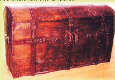
Historische Landeslade (ehemaliges Archiv der Grafschaft Hauenstein)

Geschichtsforschung liegt im Interesse der Gegenwart, weil man einerseits viele Entwicklungen der Landschaft, der Bevölkerung, des Brauchtums und der Technik nur aus ihrer früheren Entstehung verstehen kann und weil andererseits heute wieder mehr denn je die Frage nach den Wurzeln gestellt wird, aus denen sich beispielsweise eine Region wie der Hochrhein und das Hauensteinerland entwickelt hat. Geschichtsforschung setzt neben dem Interesse dafür vor allem eine große Fleißarbeit mit Suchen von Quellen, deren Auswertung und Darstellung voraus, damit sie für die Öffentlichkeit zugänglich gemacht werden kann. Eine Geschichtsforschung, beispielsweise über eine bestimmte Region, führt nach Sammlung der Erkenntnisse mit Beispielen von historischen Gegenständen, schriftlichen und anderen Nachweisen dann zu einem Ergebnis, wenn diese möglichst chronologisch geordnet dargestellt werden können.